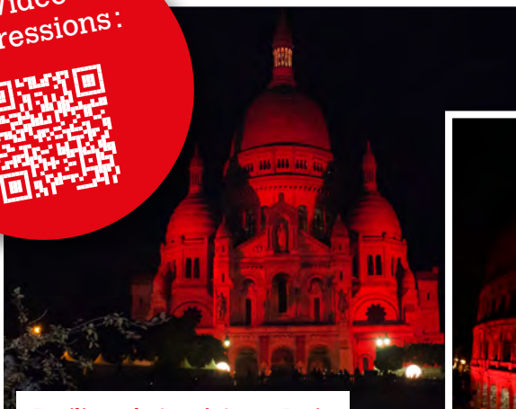
Basilique du Sacré-Cœur, Paris

Nous nous réjouissons également des photos illustrant vos actions, que nous publierons volontiers sur notre site internet. Un grand merci !