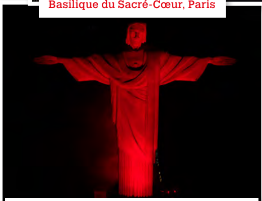
Statue du Christ Rédempteur, Rio de Janeiro