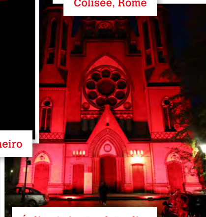
Église Saint-Paul, Berlin