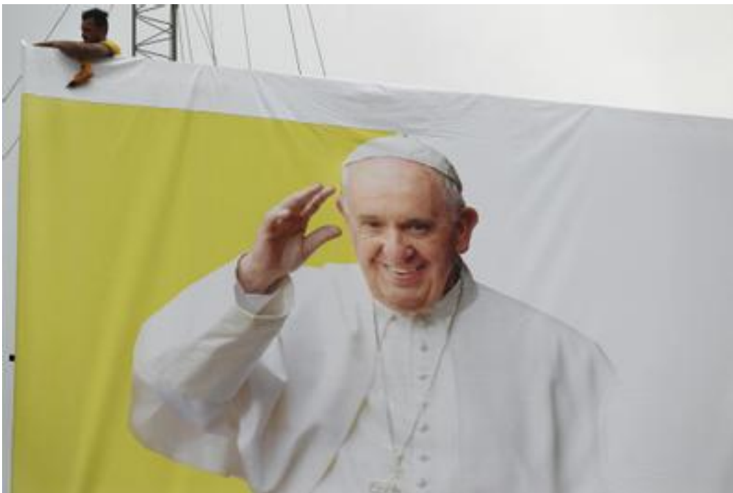
Un poster à l'effigie du pape François à Bagdad le 4 mars 2021.

Samedi et pour la première fois de l'histoire, le pape sera reçu dans la ville sainte de Najaf (sud) par le grand ayatollah Ali Sistani en personne, un homme frêle de 90 ans qui n'est jamais apparu en public. Le pape participera également à une prière à Ur, berceau d'Abraham dans le sud tribal et rural, avec des dignitaires chiites, sunnites, yazidis et sabéens.