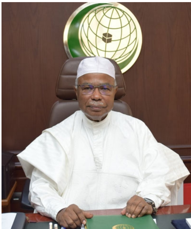
Hussein Ibrahim Taha, secrétaire général de l'OIC

Le Pakistan, l'Arabie saoudite et moult amis du prophète qui ne pratiquent pas la moindre discrimination religieuse dans leur pays se sont lancés dans un long lamento sur la terrible progression du fléau.