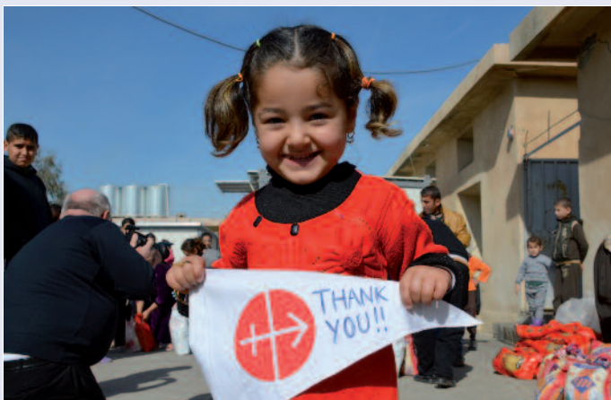
« Sans vous, nous n'aurions pas d'avenir » : les remerciements de cette petite fille valent pour des millions de chrétiens.

En 2015 aussi, la détresse des chrétiens du Proche-Orient a été au centre de l'attention des médias – et au centre de notre aide. Les coûts des mesures d'aide d'urgence et ceux des projets structurels ont plus que doublé, et représentent désormais plus d'un cinquième (21,6 %) du budget total, ce taux n'étant encore dépassé que par l'Afrique avec 29,3 %. L'aide pour la Syrie a triplé. Dans toutes les régions, il y a lieu de mentionner une augmentation de l'aide, en chiffres absolus, de l' Europe de l'Est (augmentation de 1,5 million) à l' Afrique (augmentation de 7,8 millions), en passant par le Proche-Orient (augmentation de 11,5 millions). Comme l'année dernière, la plupart des demandes d'aide nous sont parvenues d'Afrique. 2093 projets ont été traités. La seconde position est occupée par l'Europe de l'Est et l' Asie / Océanie . La plupart des offrandes de messe ont également été envoyées en Afrique et en Asie. L' Amérique latine reste certes un continent jeune et vivant d'où sont issues de nombreuses communautés catholiques nouvelles, mais les sectes et la drogue s'y répandent comme la mauvaise herbe. Là-bas, c'est surtout dans le domaine de la catéchèse qu'il faut investir.